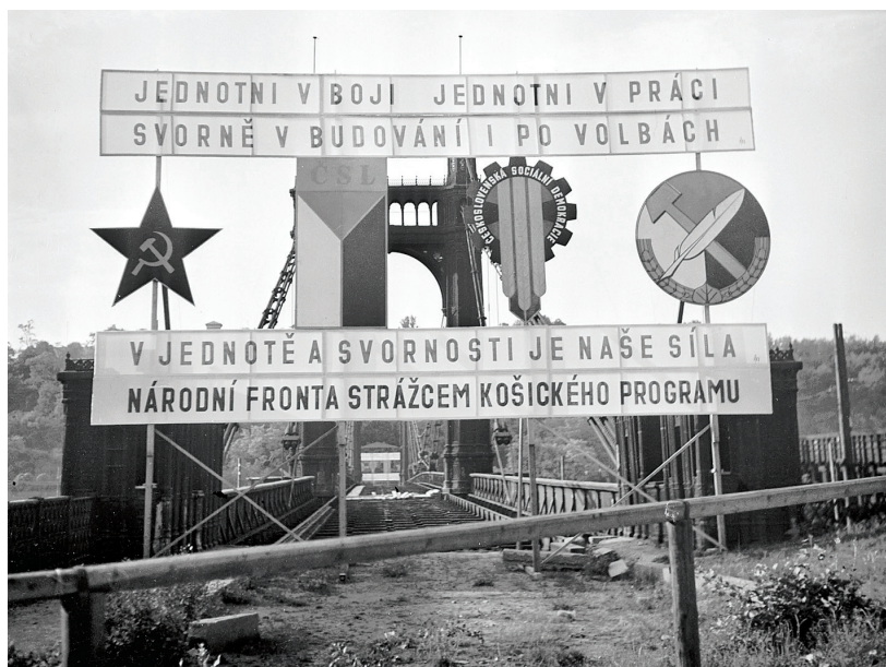
V českých zemích vstupovaly do volebního boje čtyři politické strany. Dopředu deklarovaly odhodlání k budoucí spolupráci v koalici Národní fronty.

poprvé a mohly snáze podléhat předvolební demagogii. Volební právo zůstávalo přímé, rovné a tajné. Termín parlamentních voleb vyhlášoval před válkou i po válce ministr vnitra.