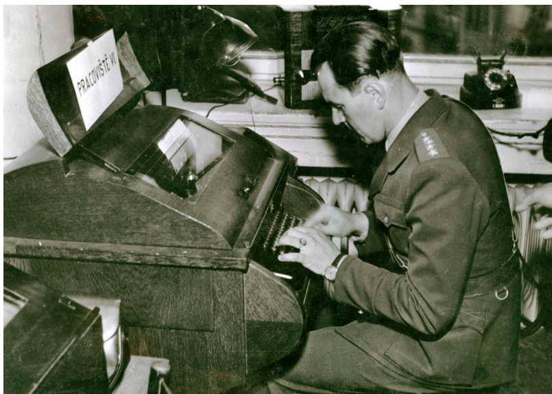
Príslušník SNB s pomocí dálhopisu komunikuje s volebními výbory v regionech

Volební systém první republiky neponechával příliš prostoru pro manévrování. Aktivní volební účast, pokud nebyla občanovi vysloveně zakázána, byla pro něj povinností. Výjimku měly především osoby přestárlé a nemocné, jinak za neúčast u voleb hrozila pokuta až do výše pět tisíc korun. Nejčastěji se pokuty pohybovaly v rozmezí několika set korun, což byl zhruba měsíční výdělek dělníka. Vyjádřit svůj občanský postoj nebo nesouhlas s politickým establishmentem demonstrativní neúčastí u voleb tak mohl pouze ten, kdo na to měl. Jedinou alternativou bylo odevzdání neplatného hlasovacího lístku, což ovšem není zrovna okázalé vyjádření postoje. Poválečný zúžený výběr musel být pro voliče ještě více frustrující, když navíc po přechodném období roku 1945 „partokracie“ nejen nevytizela, ale naplno se rozbujele v systému Národní fronty. 7 Ve volbách zůstal zachován jak poměrný volební systém, který sliboval pestré složení parlamentu a nutnost vládní koalice, tak i dříve kritizované vázané kandidátní listiny. Národně