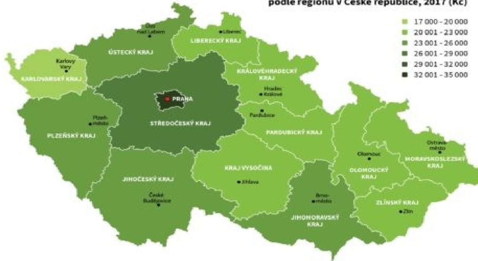
Median celkový hrubý měsíční plat v obchodě podle regionů v České republice, 2017 (Kč)

https://www.investujeme.cz/tiskove-zpravy/regionalni-rozdily-ve-mzdach-oblasti-obchodu-jsou-velke-vydelky-praze-jsou-az-43-vyssi-nez-regionech/