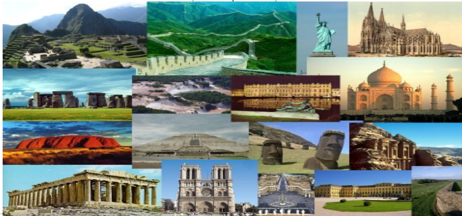
Obr. 1: Vybrané památky UNESCO