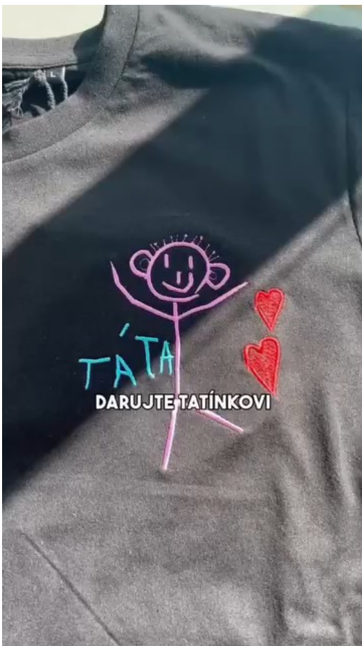
Individualismus ve výrobě