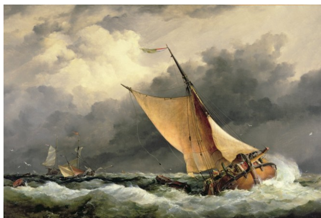
Nizozemské nákladní lodě na rozbouřeném moři (Edward William Cooke)