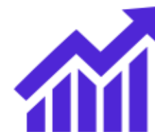
Year-on-year Growth (at least 30%)

Startups are defined by the professional public primarily as those subjects, whose business is scalable and innovative. From the investor point of view there has to be the prospect of exit, which distinguishes startup from a traditional business, for example.