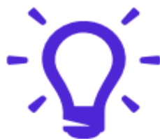
Innovative Component (fresh approach to the problem)