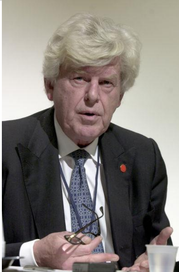
Wim Duisenberg – první prezident (1998-2003)