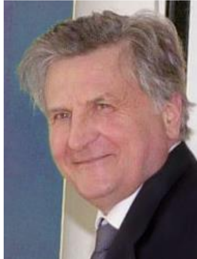
Jean-Claude Trichet prezident ECB 2003-2011