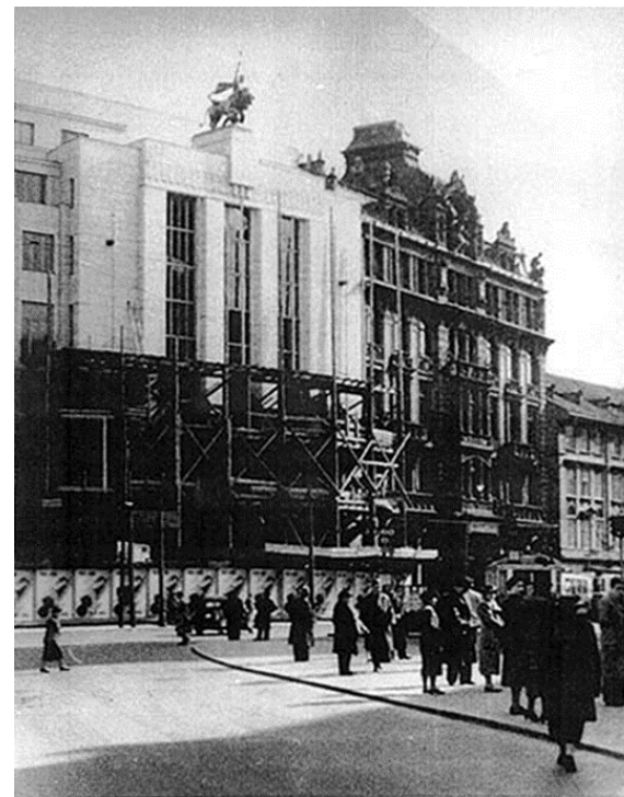
ŽIVNOSTENSKÁ BANKA V ČERVNU 1938