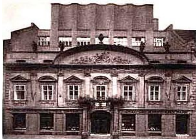
Budova Anglo-československé banky v Praze, Hybernská ulice