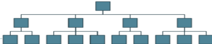
Obrázek : Plochá organizační struktura

• pro plochou organizační strukturu je charakteristický nízký počet stupňů řízení a široký rozsah řízení. Odstraňuje nevýhody strmé (vysoké) organizační struktury, a to především zkrácení komunikačních cest a snížení nákladů na vedoucí pracovníky. Naopak problémem tohoto typu je, že vyžaduje velmi kvalitní vedoucí pracovníky, neboť mají mnoho podřízených a hrozí nebezpečí, že o nich ztratí potřebný přehled a také hrozí jejich přetížení.