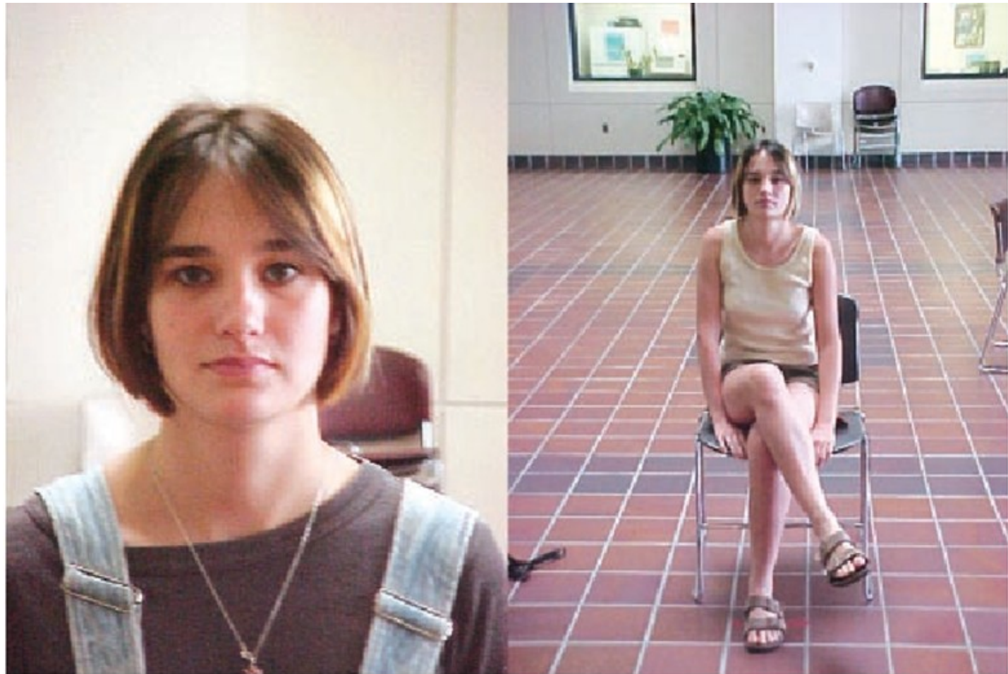
Fig 13 Photos showing different ideas of relation between central figure