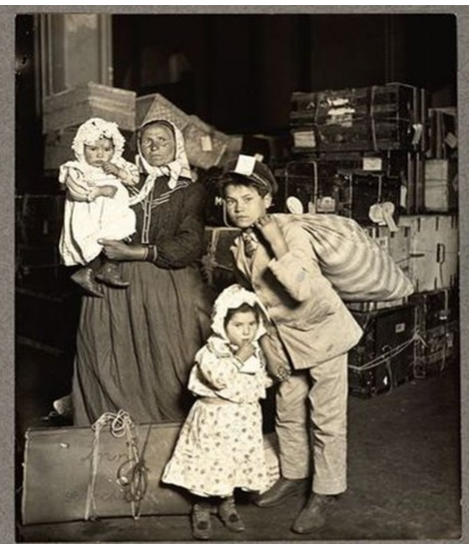
4. ITALIAN IMMIGRANTS AT ELLIS ISLAND - 1905

Lost baggage is the cause of their worried expressions. At the height of immigration the entire first floor of the administration building was used to store baggage