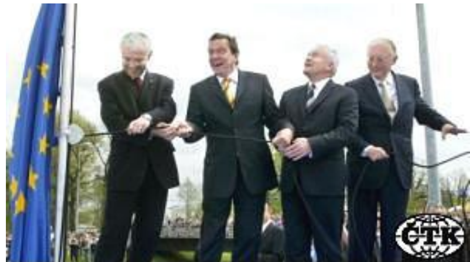
Vlajku Evropské unie vztyčují (zleva) Vladimír Špidla, Gerhard Schröder, Leszek Miller a Günter Verheugen, kteří ještě před odjezdem na summit v irském Dublinu 1. května oslavili rozšíření EU v česko-polsko-německém Trojmezí mezi Hrádkem nad Nisou, Žitavou a Bogatyní.