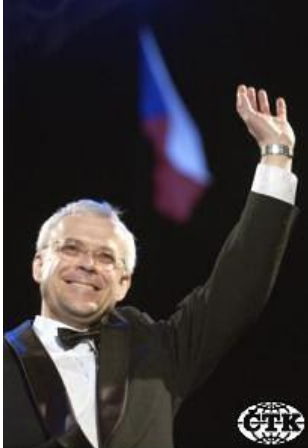
Premiér Vladimír Špidla zdraví občany, kteří v noci na 1. května na pražském Staroměstském náměstí slavili vstup Česka do Evropské unie.