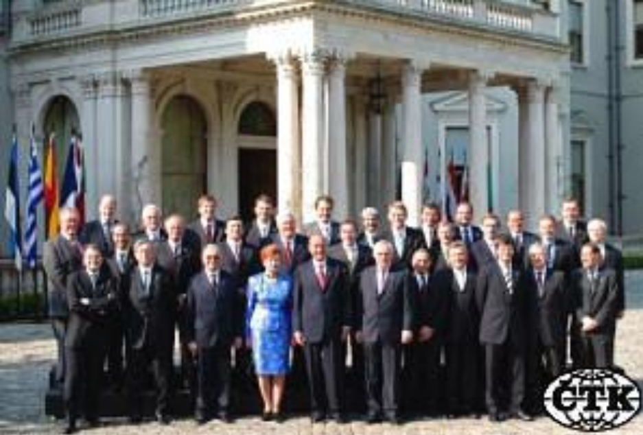
Skupinový snímek účastníků summitu v Dublinu, kterým 1. května vyvrcholily oslavy rozšíření Evropské unie