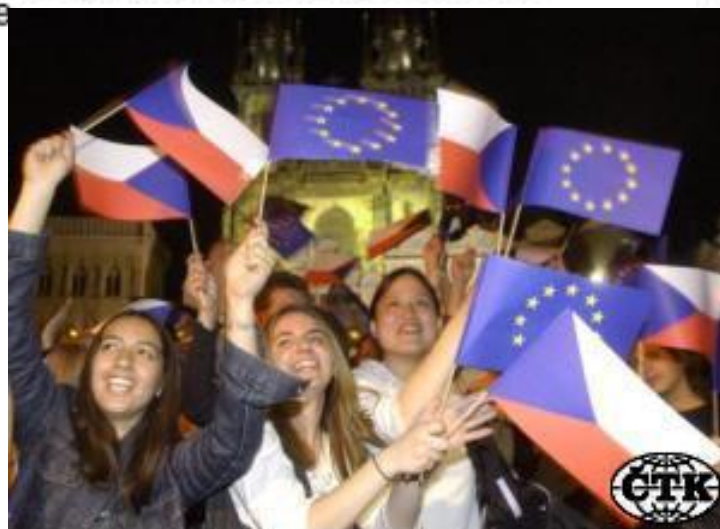
Mávající davy na Staroměstském náměstí v Praze, kde se 30. dubna večer konal slavnostní koncert u příležitosti vstupu ČR do EU.