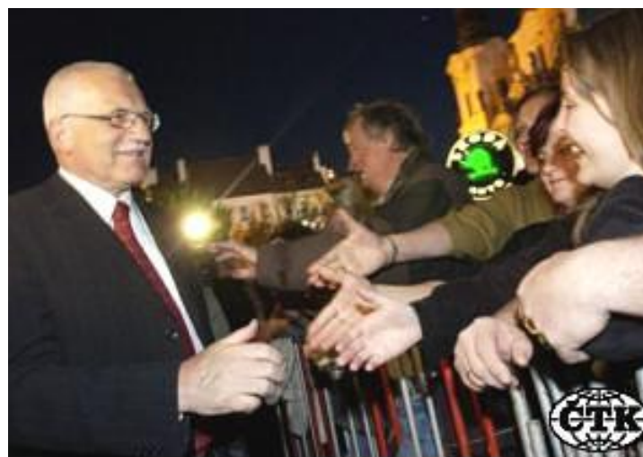
Prezident Václav Klaus se 30. dubna na pražském Staroměstském náměstí pozdravil s lidmi, kteří sem přišli oslavit vstup Česka do Evropské unie.