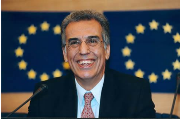
P. Nikiforos Diamandouros (2003-2013)