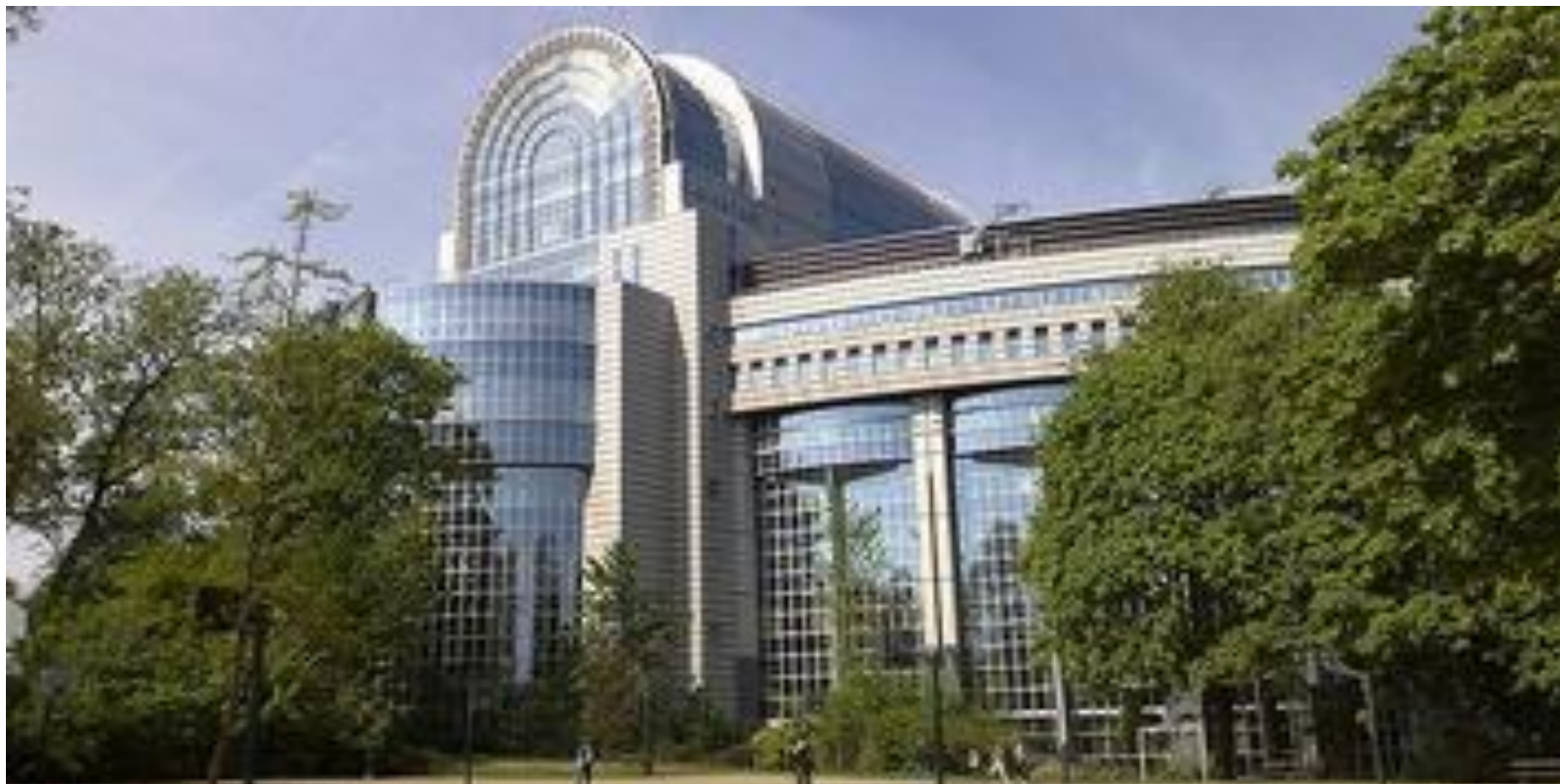
Budova EP v Bruselu