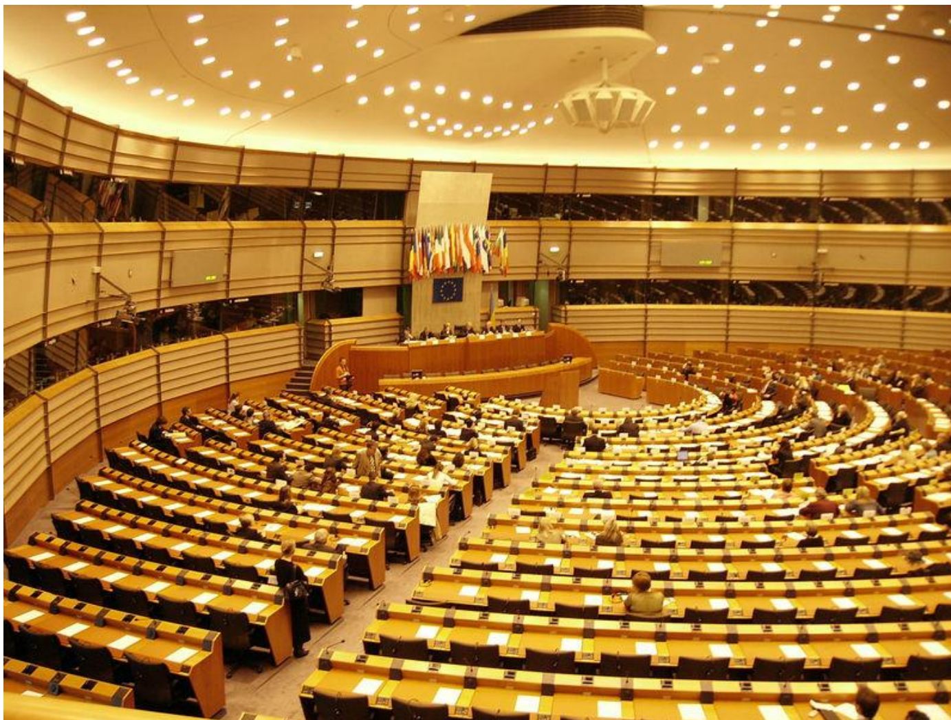
Plenární zasedání v Bruselu