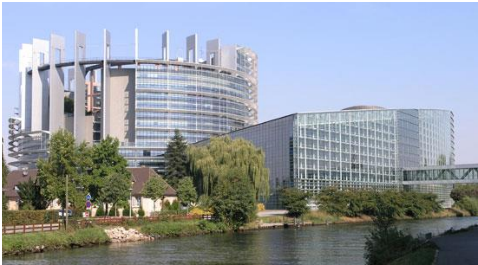
Budova EP ve Štrasburku