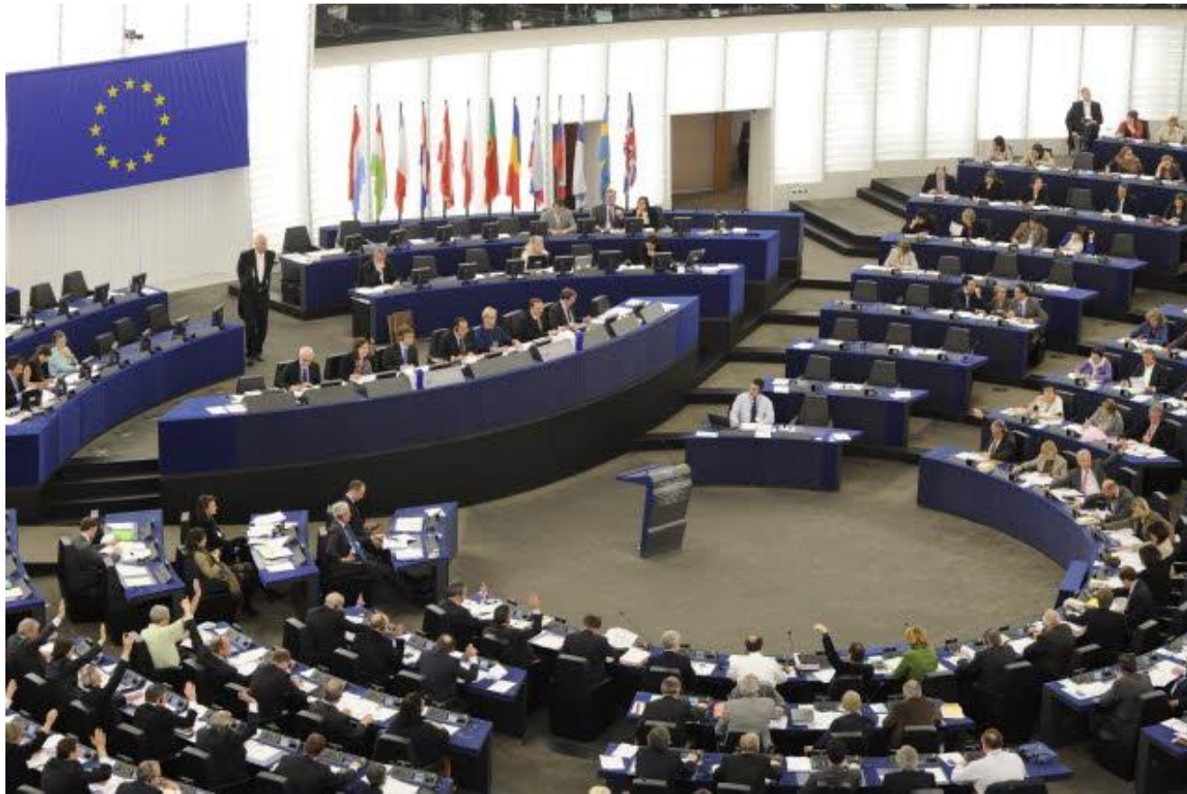
Plenární zasedání ve Štrasburku