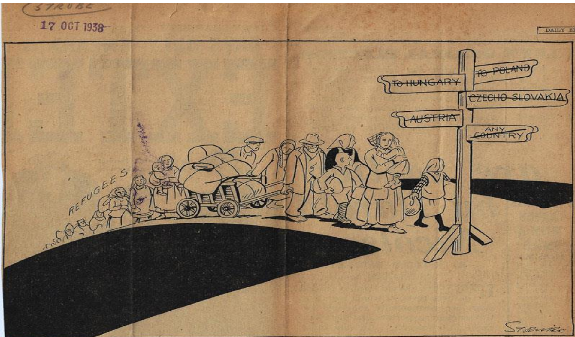
EUROPEAN CROSS ROADS