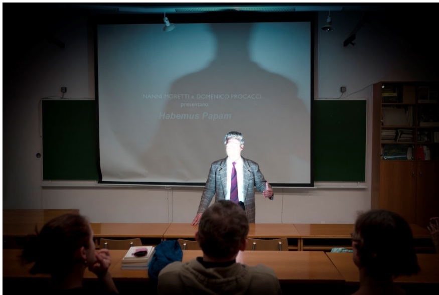
Popis obrázku 1