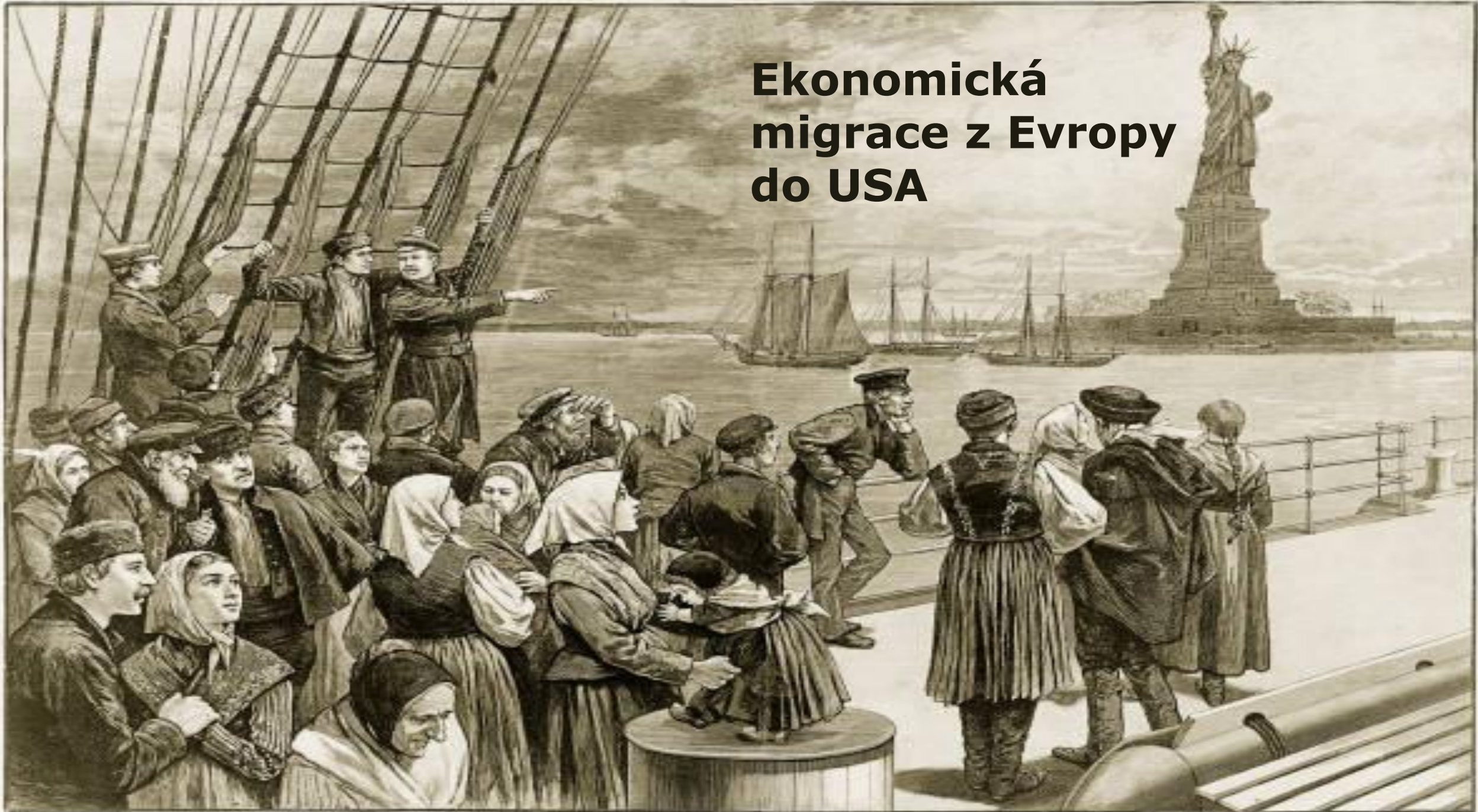
Immigrants Arriving in New York City, 1887 Emigration