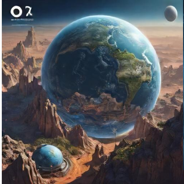
In a thousand years

AI prompt „Design a picture of the earth in a thousand/10 000 years“.